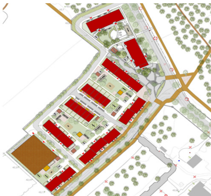
Figur, illustration av förslag om möjlig utveckling Trombonen och Slagverket, Visborg