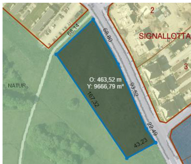
Figur, möjlig utveckling av fastigheten Visby Artilleriet 1:33

I och med att Stadsutveckling Visborg föreslås för gruppbostad så framhåller mark- och exploateringsverksamheten och beställaren del av fastigheten Visby Artilleriet 1:33 som det mest lämpliga alternativet för uppförandet av ett särskilt boende.