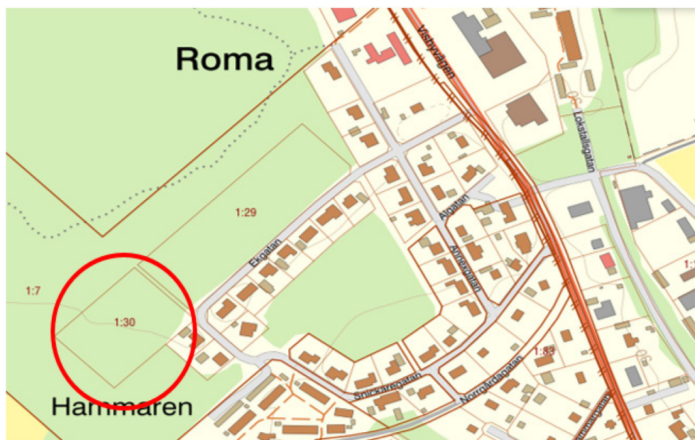
Figur, lokalisering av fastigheten Björke Annex 1:30 markerad i rött

För gruppbostad enligt SoL föreslås fastigheten Björke Annex 1:30 i Roma samhälle på mellersta Gotland. Fastigheten är sedan tidigare detaljplanlagd. Gällande detaljplan 09-BJÖ-184 anger markanvändning bostäder som får uppföras i två plan. Byggrätten anges till 20 % av fastighetens areal.